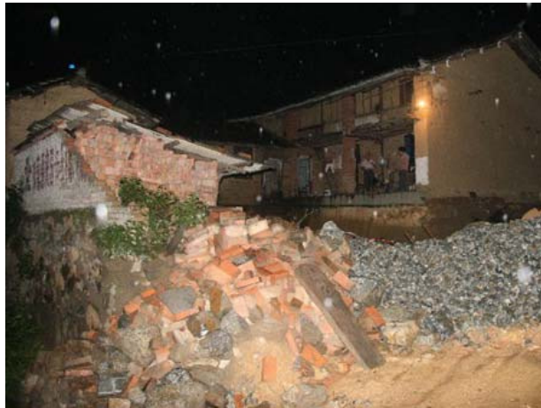
Décombres d'une maison effondrée suite au séisme

Un fort séisme est survenu le samedi 30 août 2008 à 08h30 Temps Universel (TU) à la limite entre les provinces chinoises du Yunnan et du Sichuan, dans une région déjà frappée le 12 mai dernier par un violent séisme (Mw=7.9) qui avait fait près de 88 000 morts et disparus. Selon le Service Géologique National Américain ( USGS ), ce séisme a atteint une magnitude de 5.7. De nombreuses répliques sont survenues depuis le choc principal, parmi lesquelles la secousse du 31 août 2008 à 08h31 TU, de magnitude 5.6 ( USGS ).